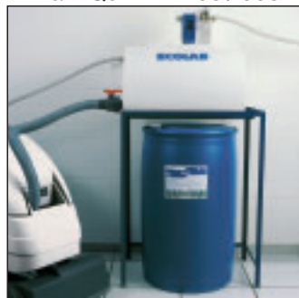
Maxi Quik Fill 100 / 300

Cumple la legislación vigente respecto a Biodegradabilidad y el Reglamento Técnico Sanitario de Detergentes.